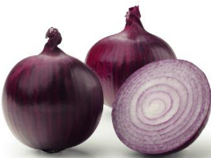
Countach, F 1