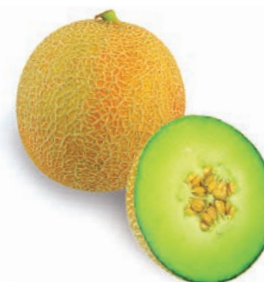
Esmeralda, F 1