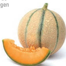
Gandalf, F 1