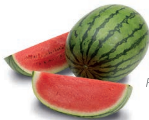
Premium, F 1