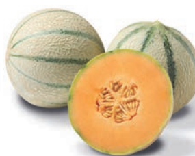
Maltese, F 1