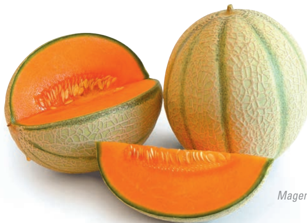
Magenta, F 1