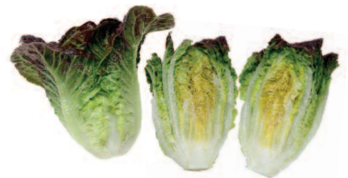
NUN 06518 LTL